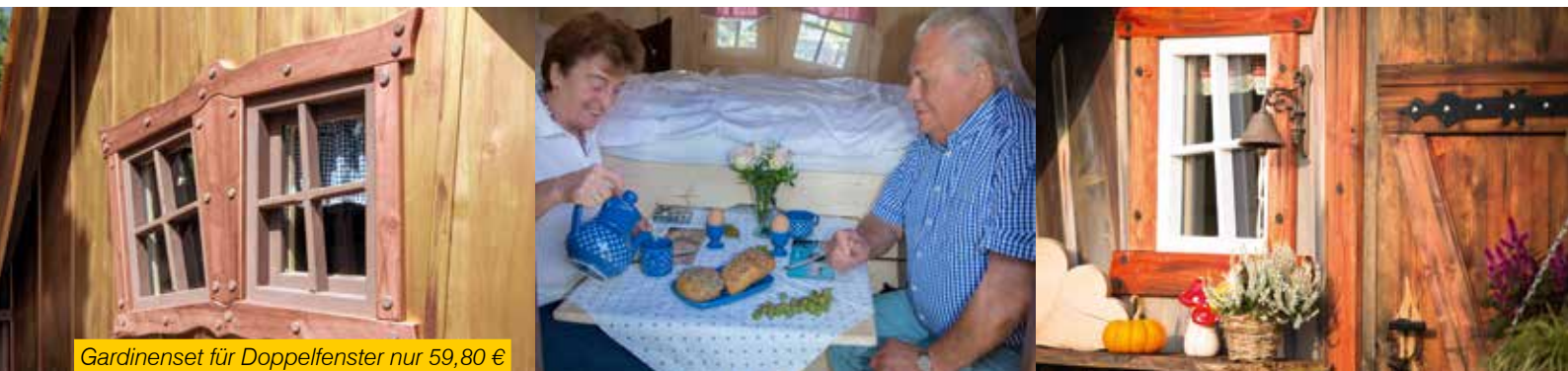
Gardinenset für Doppelfenster nur 59,80 €